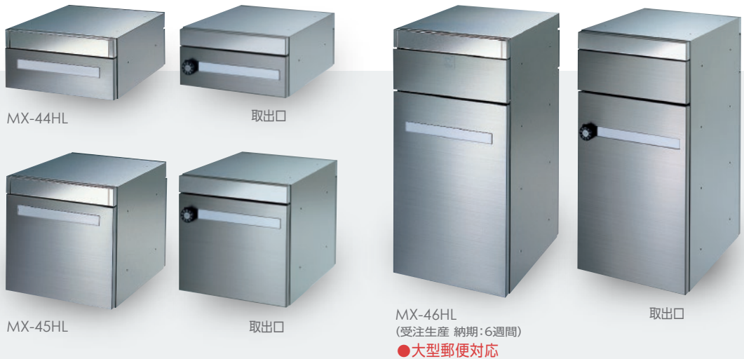
MX-46HL (受注生産 納期:6週間) ●大型郵便対応