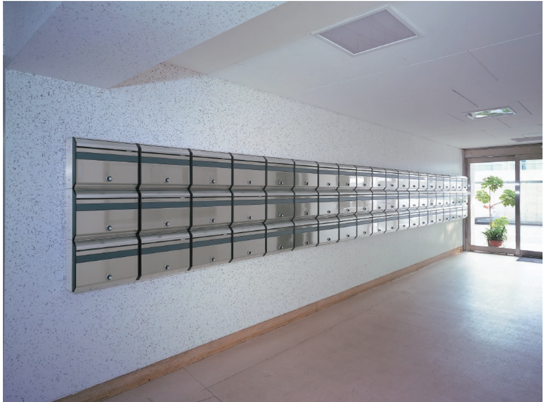
※上記写真の錠前は現在使用されていません。