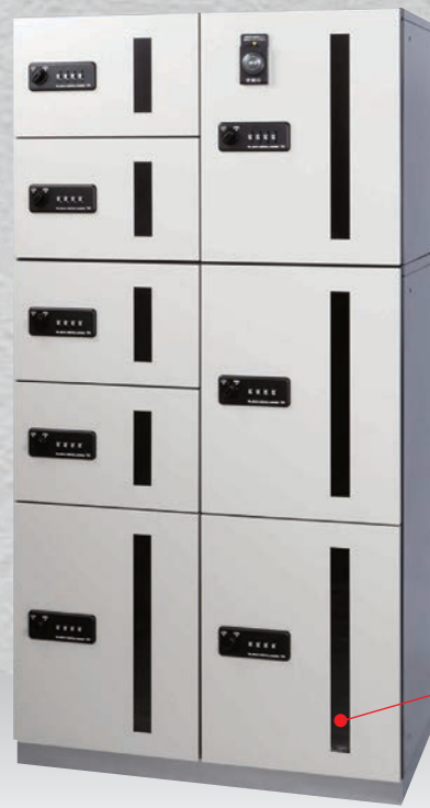
扉：スチール 焼付塗装仕上（ベージュ）