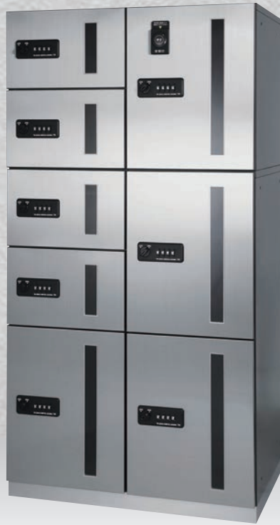
扉：ステンレス ヘアライン仕上