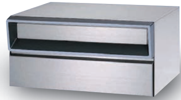
ステンレス (ヘアライン)