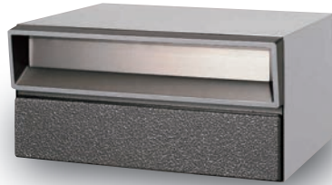
アルミダイキャスト (シルバーグレー)