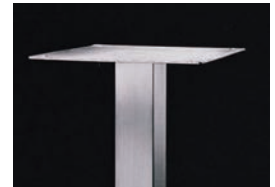
MX-301P ¥21,000 (ポール金具)