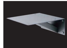
MX-301G ¥21,000 (壁付用金具)